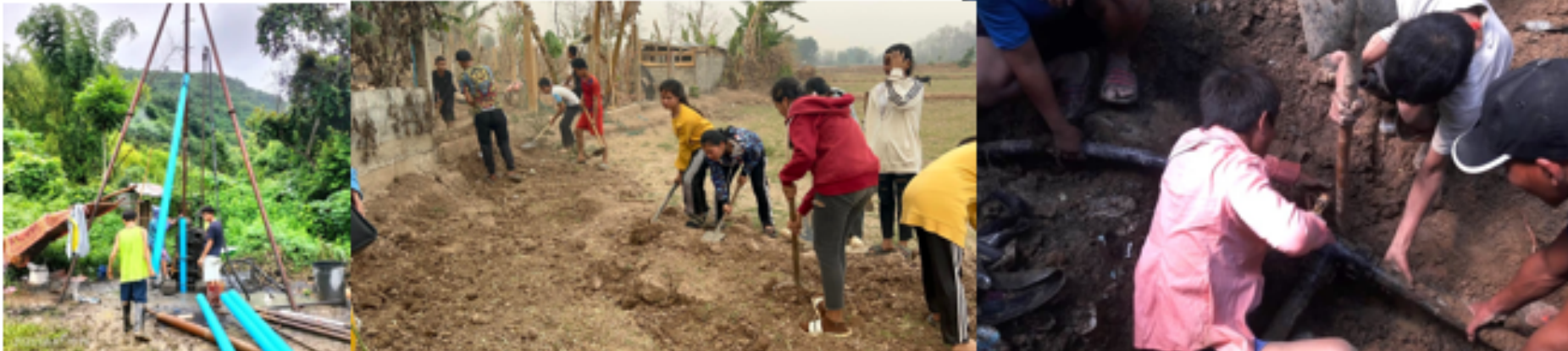
Les chantiers d'adduction d'eau de l'hôpital de MAI, de NAVANG et de CHOM ONG de 2023 (de gauche à droite)