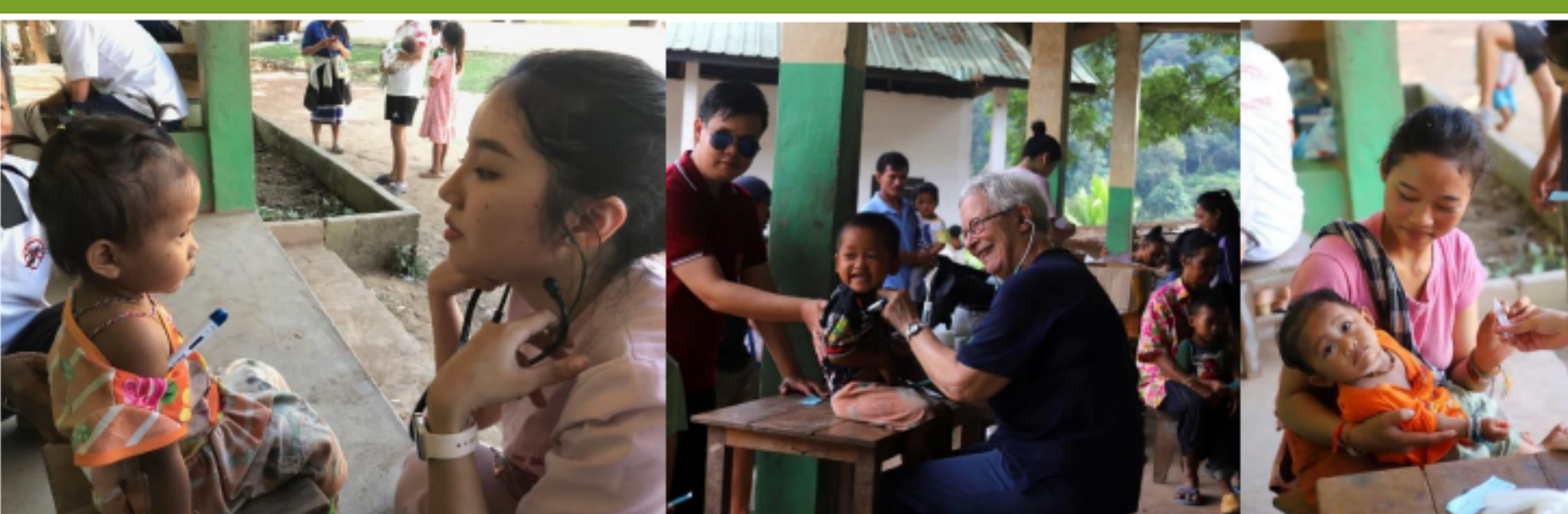
Mobile Boat Clinic 2023 (ici, spécifiquement les consultations pédiatriques avec le duo franco-lao de médecins)