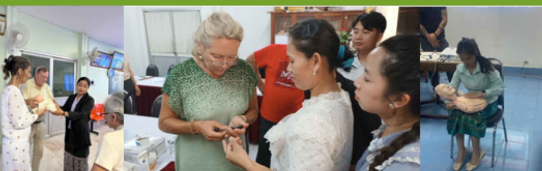
Formation en gynécologie, formation au diabète, formation à l'urgence médicale (de gauche à droite)